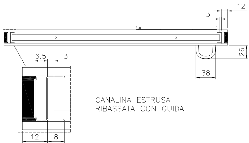
CANALINA ESTRUSA RIBASSATA CON GUIDA